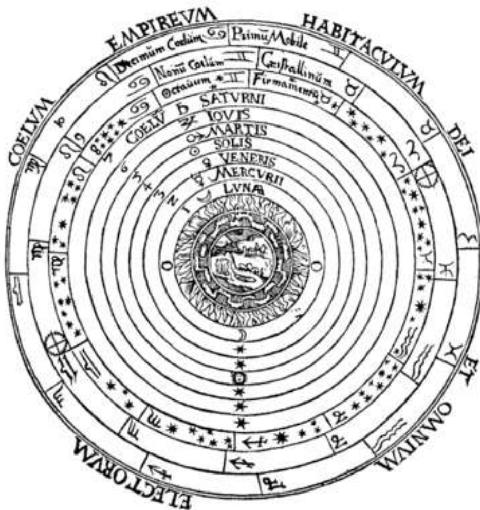
Schema huius præmissæ diuisionis Sphærarum .

Een van de minst goed begrepen en meest gecompliceerde onderdelen van de astrologie is de miraculeuze precessiebeweging. Dit is het langzame opschuiven van het lentepunt tegen de achtergrond van de vaste sterren, het lentepunt is het snijpunt van de ecliptica en de hemelequator. Als de Zon door dit punt gaat, begint de lente op het noordelijk halfrond. Dit punt is ook per definitie nul graden Ram in de tropische zodiak die in de westerse astrologie wordt gebruikt, dat is zo voor altijd daar verandert nooit iets aan, tot aan het einde der tijden. Dat is direct ook de eerste veel gemaakte fout die wordt recht gezet: het lentepunt beweegt niet door de 12 tekens – dat is uit hoofde van de definitie onmogelijk – en er kan in die zin dus ook geen tijdperken van de Ram, de Vissen of de Waterman bestaan, zoals men wel beweert. Maar de precessie is een feit, het lentepunt beweegt zich wel langs de zichtbare sterren, dus hoe zit dat dan?